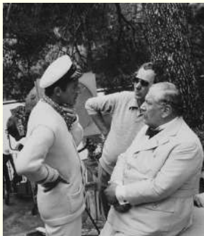
Hamilton amb Peter Ustinov

L'homenatge a Guy Hamilton consistirà en una sèrie d'actes, que tindran lloc a Palma el 27 de juny de 2017, i en els quals s'anunciarà la proposta per a que el Consell de Mallorca li concedeix el títol de Fill Adoptiu de Mallorca.