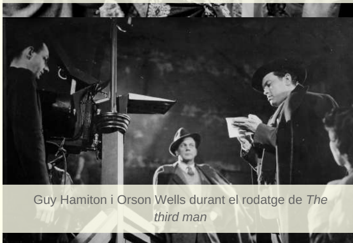
Guy Hamilton i Orson Welles durant el rodatge de The third man

Diversos títols seus es desenvolupen en escenaris de la Segona Guerra Mundial, com The Colditz Story (1955), Funeral in Berlin (1967), Battle of Britain (1969) o Force 10 of Navarone (1978), en la qual debutà Harrison Ford en el seu primer paper protagonista. Totes aquestes pel·lícules tenen un repartiment d'estrelles de la talla de Michael Caine, Trevor Howard o Edward Fox.