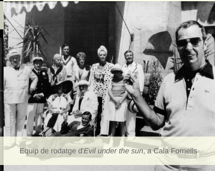
Equip de rodatge d' Evil under the sun , a Cala Fornells

A final dels anys vuitanta, després d'una carrera llarga i intensa com a director, Guy Hamilton i la seva esposa, l'actriu francesa Kerima, decidiren instal·lar-se a Mallorca, que ja coneixien d'estades anteriors, i construir-se una casa al Port d'Andratx. Hamilton hi visqué fins que morí amb 93 anys, el 20 d'abril de 2016.