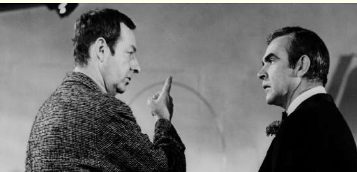
Guy Hamilton dirigint Sean Connery a "Goldfinger"