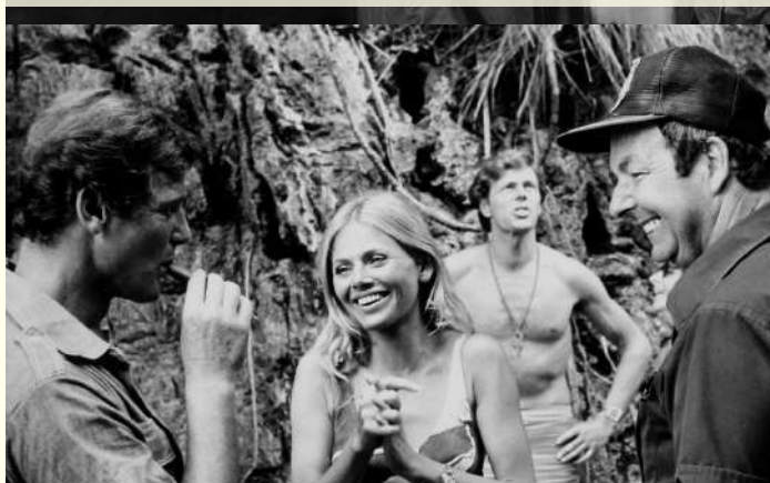
Britt Eckland, entre Roger Moore i Guy Hamilton, durant el rodatge de The Man with the Golden Gun