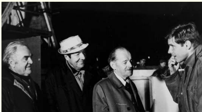
Harrison Ford va rebre el seu primer paper protagonista de Guy Hamilton a Force 10 Navarone

Quatre de les pel·lícules més emblemàtiques de la sèrie sobre James Bond, el superagent 007, les dirigí ell: Goldfinger (1964), Diamonds are forever (1971), Live and let die (1973) i The man with the golden gun (1974), les que llançaren a la fama Sean Connery i Roger Moore.